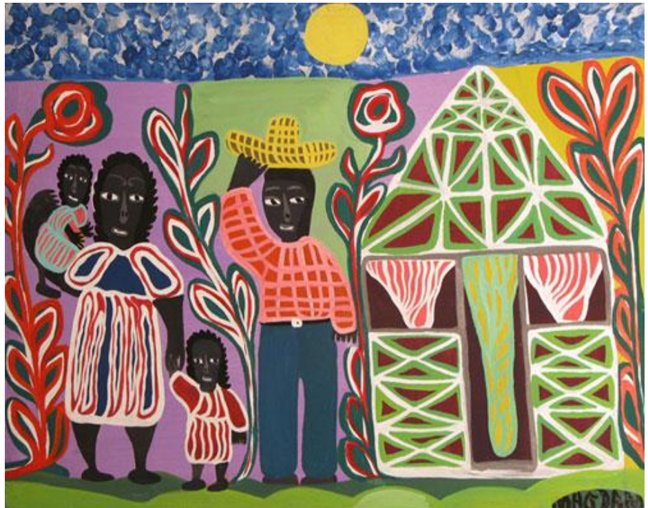
Magda MAGLOIRE, Famille , 2008

En 2003, près de 40% de la population dont 42% de femmes et 36% d'hommes ne savait ni lire ni écrire